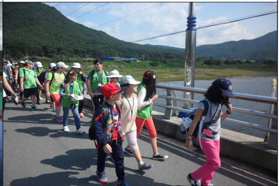
(8/30) 도보학습 매화마을을 둘러가는 길을 따라 도보학습