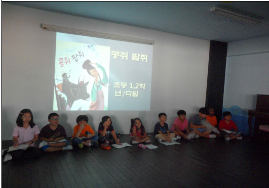
(8/26) 독서골든벨 방학동안 읽을거리로 나갔던 책에 대한 내용과 의미를 확인하는 퀴즈대회