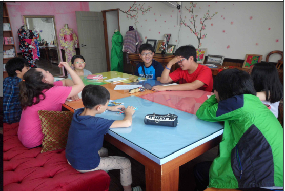
(8/27) 대사관 회의 2학기 운영 계획과 활동 상황을 점검해보는 시간