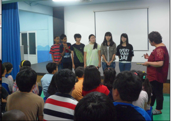
(8/25) 개학식 2학기 다짐과 포부를 듣는 시간