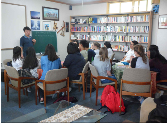
(8/11) 귀신축제 브리핑 청소년대사관대사들과 귀신축제 개최