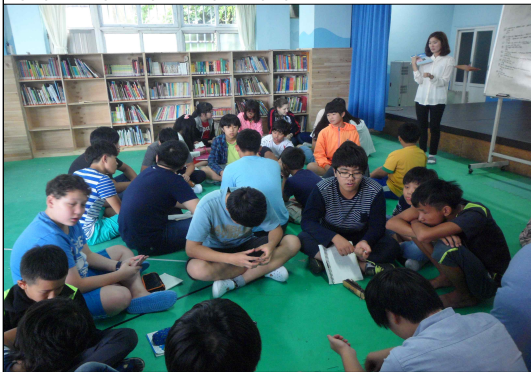
(8/29) 생태체험학습회의 생태체험학습을 떠나기 전 각 조의 식단과 목표를 의논하는 시간